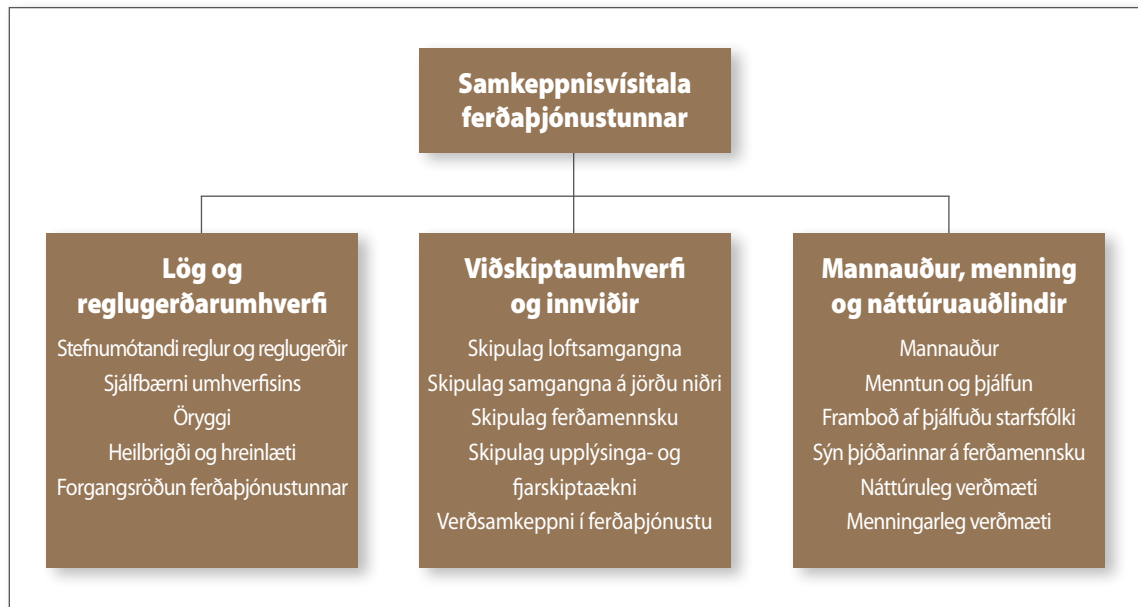
Tafla 1: Samkeppnisvísitalan skiptist í þrjár undirvísitölur sem hver er samsett úr fjölda einstakra stoða.

Fyrsta undirvísitalan nær yfir þá þætti sem tengjast stefnumótun og falla almennt undir verksvið opinberrar stjórnsýslu (stefnumótandi reglur og reglugerðir, umhverfisreglugerðir, öryggi og forgangsröðun ferðaþjónustu), önnur undirvísitalan nær yfir þætti í rekstrarumhverfi og skipulagi hvers hagkerfis (skipulag loftsamgangna, skipulag samgangna á jörðu, skipulag ferðamála, skipulag upplýsinga- og fjarskiptatækni og verðsamkeppnishæfni) og þriðja undirvísitalan nær yfir mannlega, menningarlega og náttúrulega þætti í auðlindum hvers lands (mannauður, sýn þjóðarinnar á ferðamennsku og náttúruleg og menningarleg verðmæti).